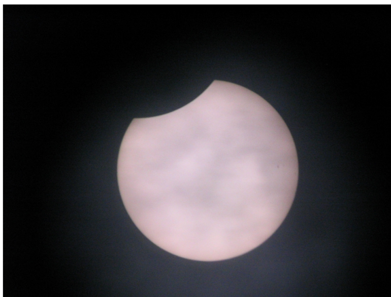
Eclipse partielle du 29 mars 2006