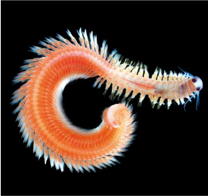
Zooplankton des Iles Gambier, groupe des Platynereis, espèce indéterminée.