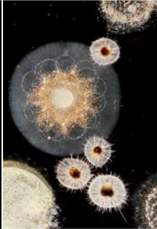
Protistes, composés d'une seule cellule semblable aux nôtres.

Un pour tous et tous pour un ! Cette célèbre devise pourrait être celle des chercheurs de Tara Oceans. Chacun selon sa spécialité s'affaire sur des données, sur des échantillons, mais tous portés par l'ambition commune de comprendre le fonctionnement des écosystèmes marins. En ce sens, l'expédition est déjà un succès : elle a permis de rassembler des experts d'horizons différents autour d'une même aventure scientifique.