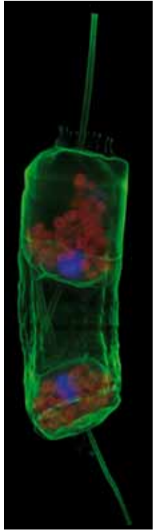
Protiste illuminé par fluorescence.