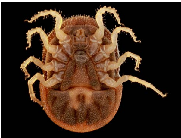
Vue ventrale de la tique molle Ornithodoros moubata infectée par une bactérie symbiotique du genre Francisella

connues aujourd'hui, ont ainsi été grandement conditionnées par cette symbiose. Ce processus souligne l'importance des microorganismes dans la diversité écologique des animaux et l'évolution de nouveaux régimes alimentaires.