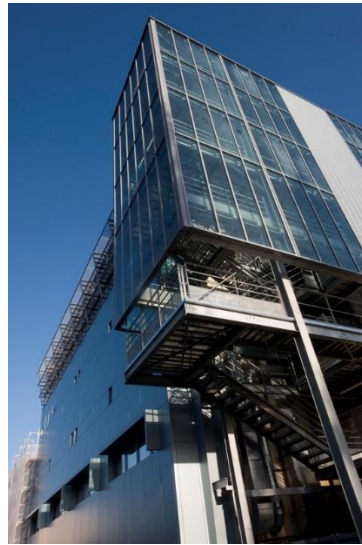
Vue de la plateforme MIRCen, installation de recherche préclinique développée par le CEA et l'Inserm

Le LMN est situé au sein de MIRCen (Molecular Imaging Research Center) une installation de recherche préclinique développée par le CEA et l'Inserm. MIRCen est un des départements de l'institut de biologie François Jacob du CEA, sur le site de Fontenay-aux-Roses du CEA Paris-Saclay.