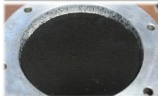
Comète artificielle avec sel d'ammonium