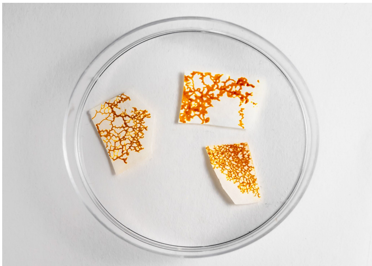
Fragments de blob en dormance.

Quand les conditions se dégradent (le milieu devient sec et la nourriture vient à manquer), le blob entre en dormance. Il se réveillera lorsque les conditions s'amélioreront.