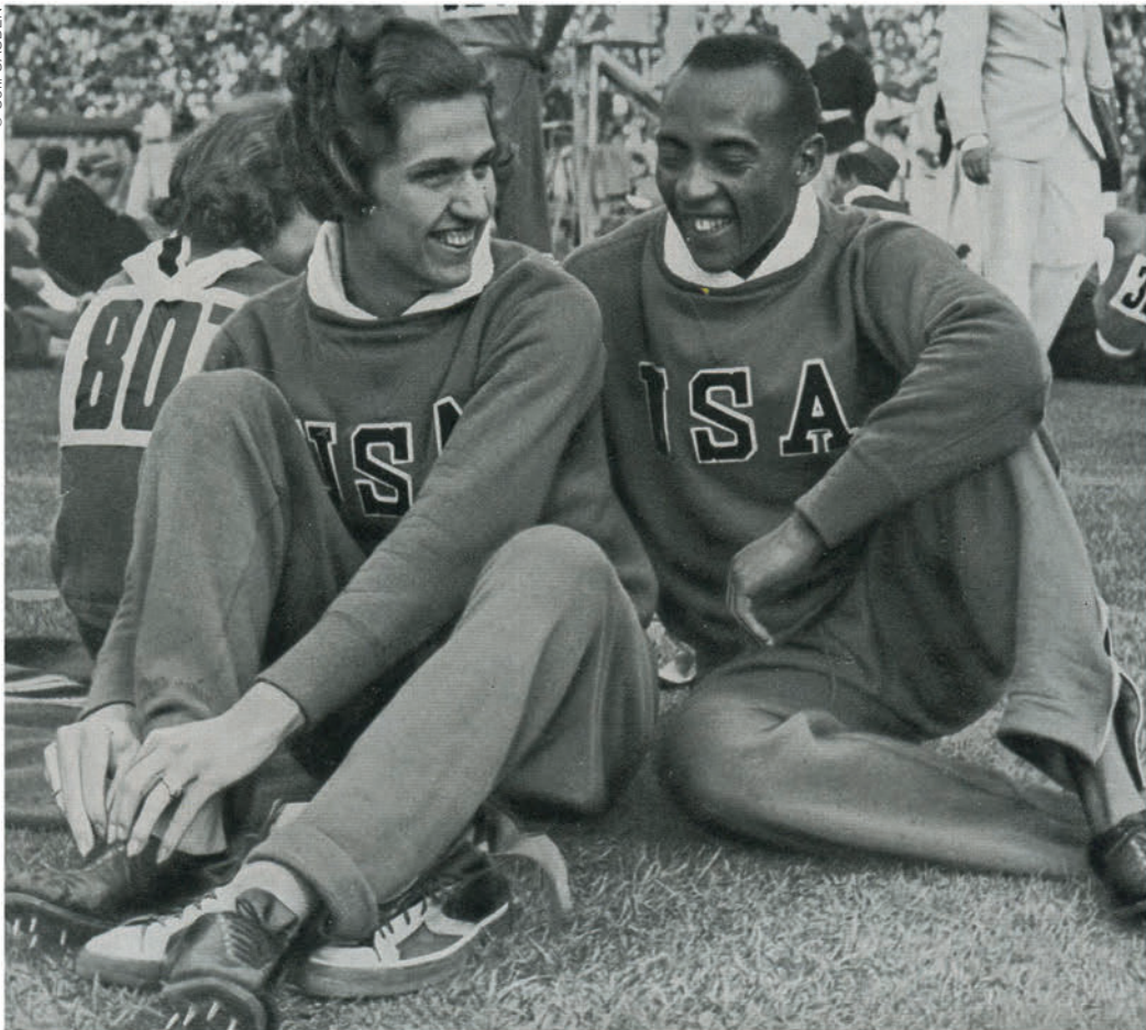
Helen Stephens et Jesse Owens, Berlin, 1936.