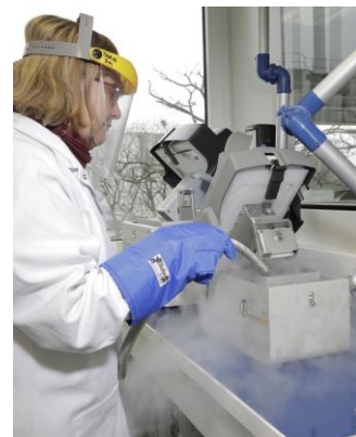
Extraction d'ARN au CEA-Genoscope