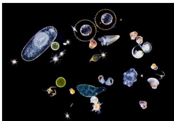
Protistes et larves planctoniques