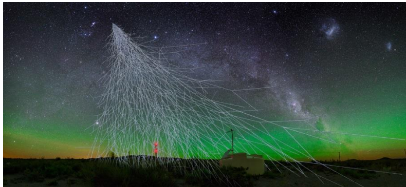
Vue d'artiste d'une gerbe atmosphérique au-dessus d'un détecteur de particules de l'Observatoire Pierre Auger, sur fond de ciel étoilé.