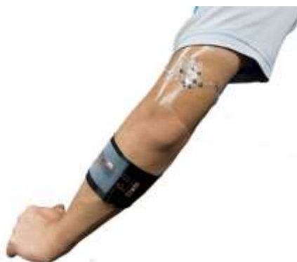
Image de la biopile portable collée sur un bras et alimentant une diode fixée sur le brassard noir entourant l'avant-bras.