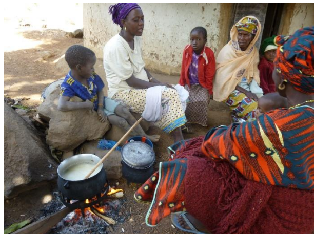
Les femmes du village Kouroupampa (Guinée) faisant la cuisine (photo issue du corpus en langue kakabe).