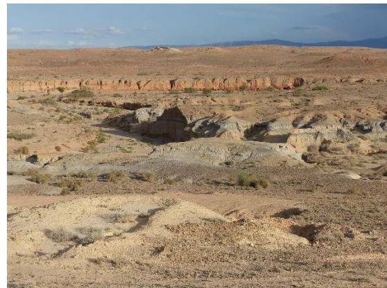
Plaine de Blirh, Bassin de Ksabi, Moyenne Moulouya, Maroc oriental