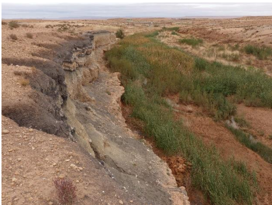
Oued Tabouda, Hauts Plateaux du Maroc oriental

L'étude qui vient de paraître, porte sur les archives sédimentaires alluviales du bassin de la Moulouya et des Hauts Plateaux du Maroc oriental. Elle vient combler le manque de travaux sur cette région aride séparée du Sahara par le massif de l'Atlas.