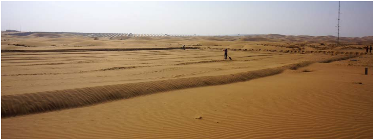
Préparation de la zone d'étude, phase d'aplanissement, le 10 Avril 2014

Sylvain Courrech du Pont – Maître de conférence Univ. Paris – sylvain.courrech@univ-paris-diderot.fr