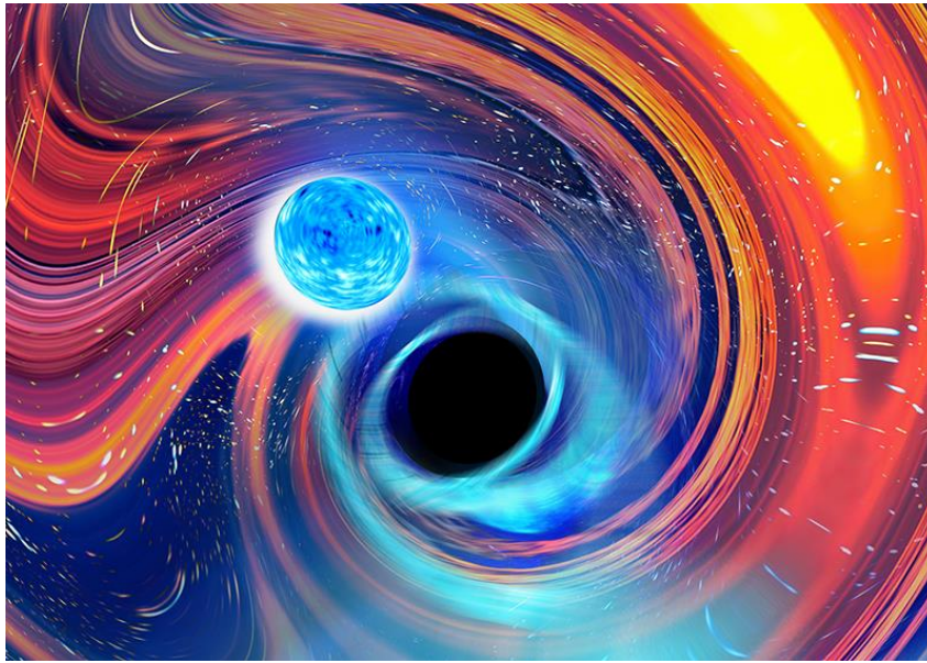
Vue d'artiste d'une fusion trou noir-étoile à neutrons. © Carl Knox, OzGrav -Swinburne University