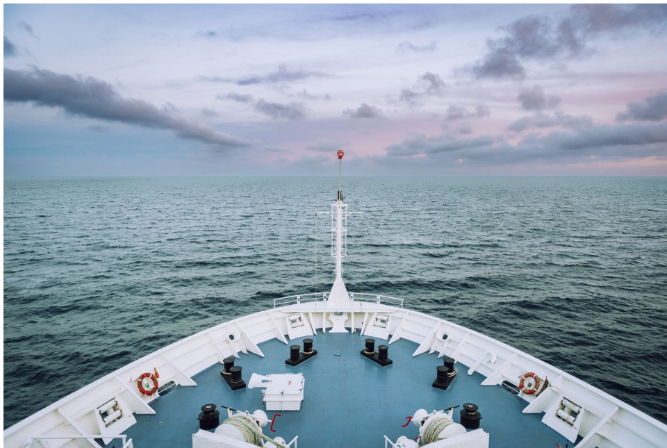
Pont avant du navire océanographique Pourquoi pas ?

2- Au niveau de la station permanente britannique PAP ( Porcupine Abyssal Plain ), à environ 570 km au sud-ouest de l'Irlande.